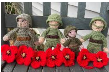
The longest yarn

- Assiette du pêcheur, rillettes de crabe, saumon fumé, terrine de coquilles st jacques 14€