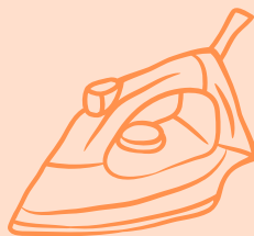
Table et fer à repasser disponibles dans la pièce proche du salon.